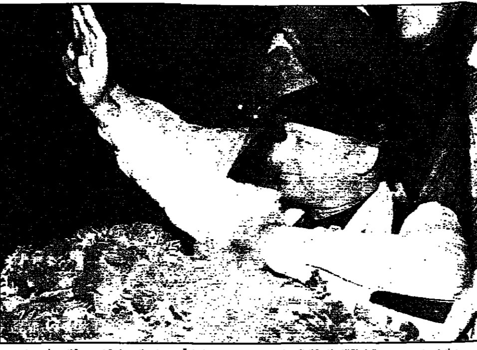
نواز شريف زعيم حزب الرابطة الإسلامية الباكستاني يحيي مؤيديه عقب انتصاره في الانتخابات في مدينة لاهور

■ أثينا - يتوقع مسؤولون في الخارجية اليونانية حدوث نشوب حرب مع أنقرة في حال فشل جهود تسوية الأزمة القبرصية. وقال مسؤولون في الخارجية اليونانية إنهم لا يتوقعون نشوب حرب مع أنقرة في حال فشل جهود تسوية الأزمة القبرصية. وقال مسؤولون في الخارجية اليونانية إنهم لا يتوقعون نشوب حرب مع أنقرة في حال فشل جهود تسوية الأزمة القبرصية.